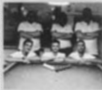
La formazione del Bar Gigi

Ha preso il via il Campionato ENDAS di serie B girone sud che si gioca nella giornata del mercoledì. Ogni incontro si snoda su 5 partite, 2 Coppie ai punti 70 e 3 Singoli ai punti 80. Dopo la 1ª giornata la classifica è guidata dal tandem Bar Gigi Onofiana e Billy 2 Cattolica a pari merito con 4 punti. I risultati: Platone 1-Caffe delle Rose 32, Billy 1-Billy 2 1-4, Bar Gigi-Platone 2 4-1, Bar L'Incontro-Bar Giorgio 2-3. La classifica dopo la prima giornata è la seguente: Bar Gigi-Billy 2 punti 4, Platone 1-Giorgio punti 3, L'Incontro-Caffe delle Rose 2, Billy 1-Platone 2 punti 1. Presenza di giocatori sammarinesi nelle squadre del Bar Gigi (Vladimiro Bertozzi), e nella squadra del Bar L'Incontro (Mario Cenci).