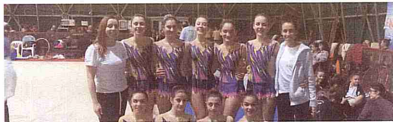
Le ginnaste scese in pedana

il suo programma ai 4 attrezzi con l'emozione che una pedana del genere comporta, cerchio palla clavette e nastro, ed ha ottenuto un punteggio di 54.500 che le ha permesso di guadagnare la 14esima posizione superando ginnaste slovene e croate.