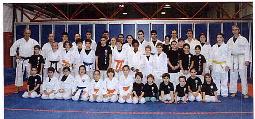
I piccoli atleti che hanno affrontato gli esami insieme ai loro tecnici