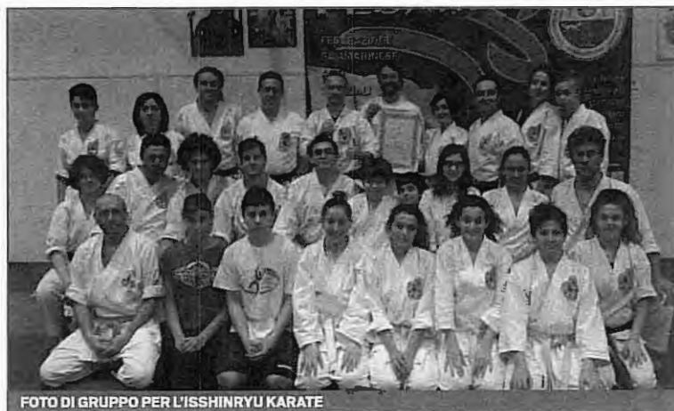
FOTO DI GRUPPO PER L'ISSHINRYU KARATE