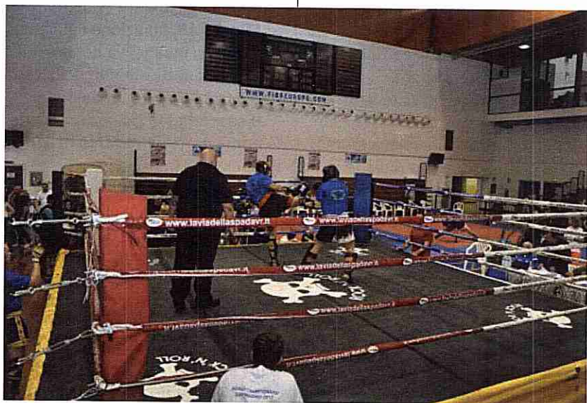
Una seconda specialità all'interno di un classico ring a dodici corde

La kick boxing è nata in Giappone negli anni sessanta. In quel periodo le uniche forme di combattimento a contatto pieno erano il full contact karate, il muay thai thailandese, il Sambo russo, il taekwondo coreano, il karate contact ed il sanda cinese.