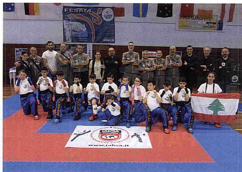
Uno scatto dell'evento tenutosi al Multieventi