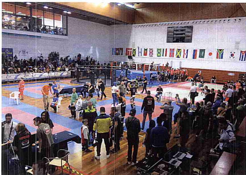
Uno scatto dell'evento tenutosi al Multieventi